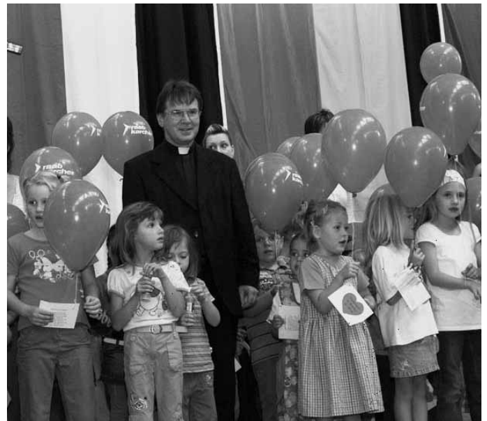
... ein Bild das für sich spricht.