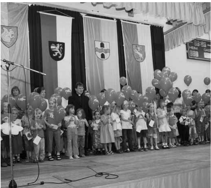
... und die Verabschiedung in der Schar der Kindergartenkinder ...