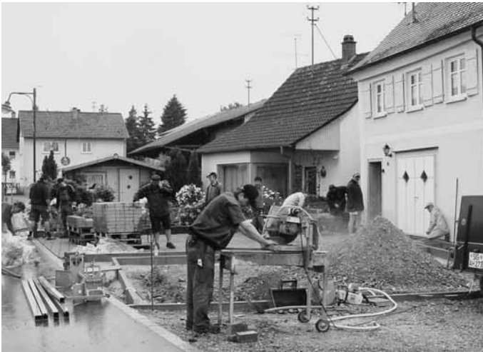
Selbst schlechtestes Wetter hielt die Bremer nicht davon ab, die Pflasterarbeiten voranzutreiben.