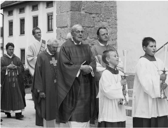
Der letzte feierliche Gang vom Pfarrhaus zur Kirche ...