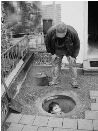
Auch die Jüngsten hatten einen "Auftrag"