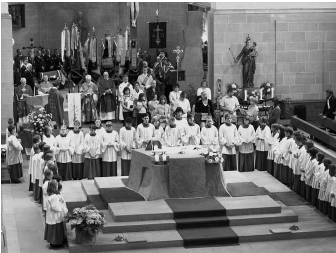
... ein großes Aufgebot ...